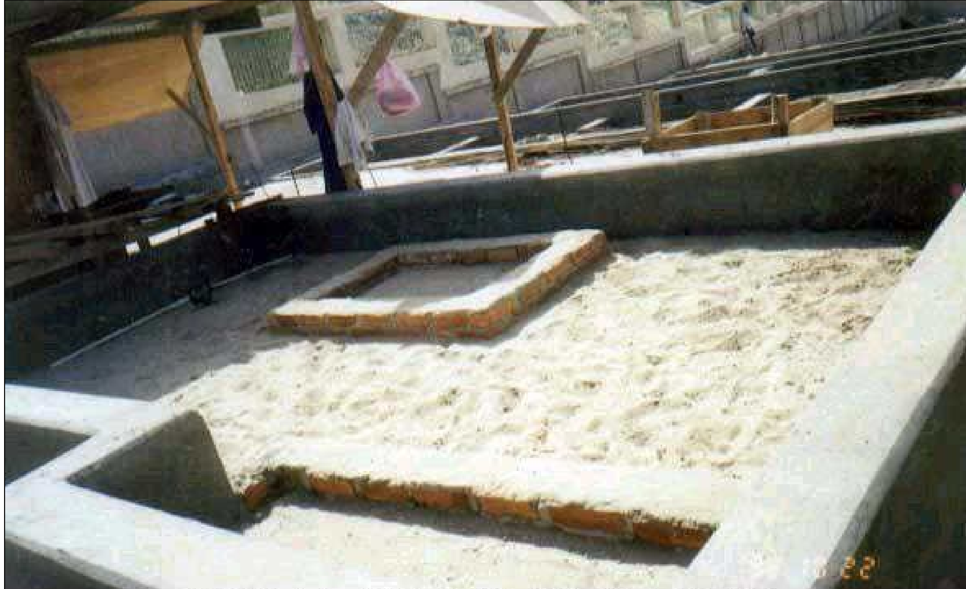
QABR-E-HAZRAT ABU TALIB UNCLE OF PROPHET MOHAMMAD MACCA