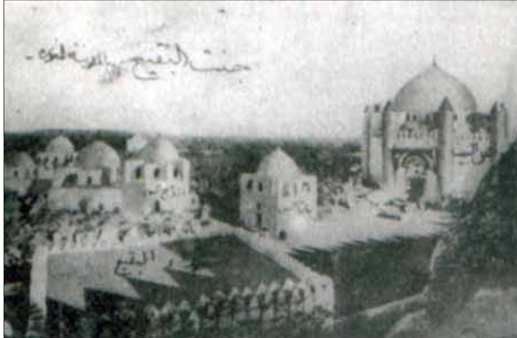
JANNATUL BAQI BEFORE DESTRUCTION (MADINA)