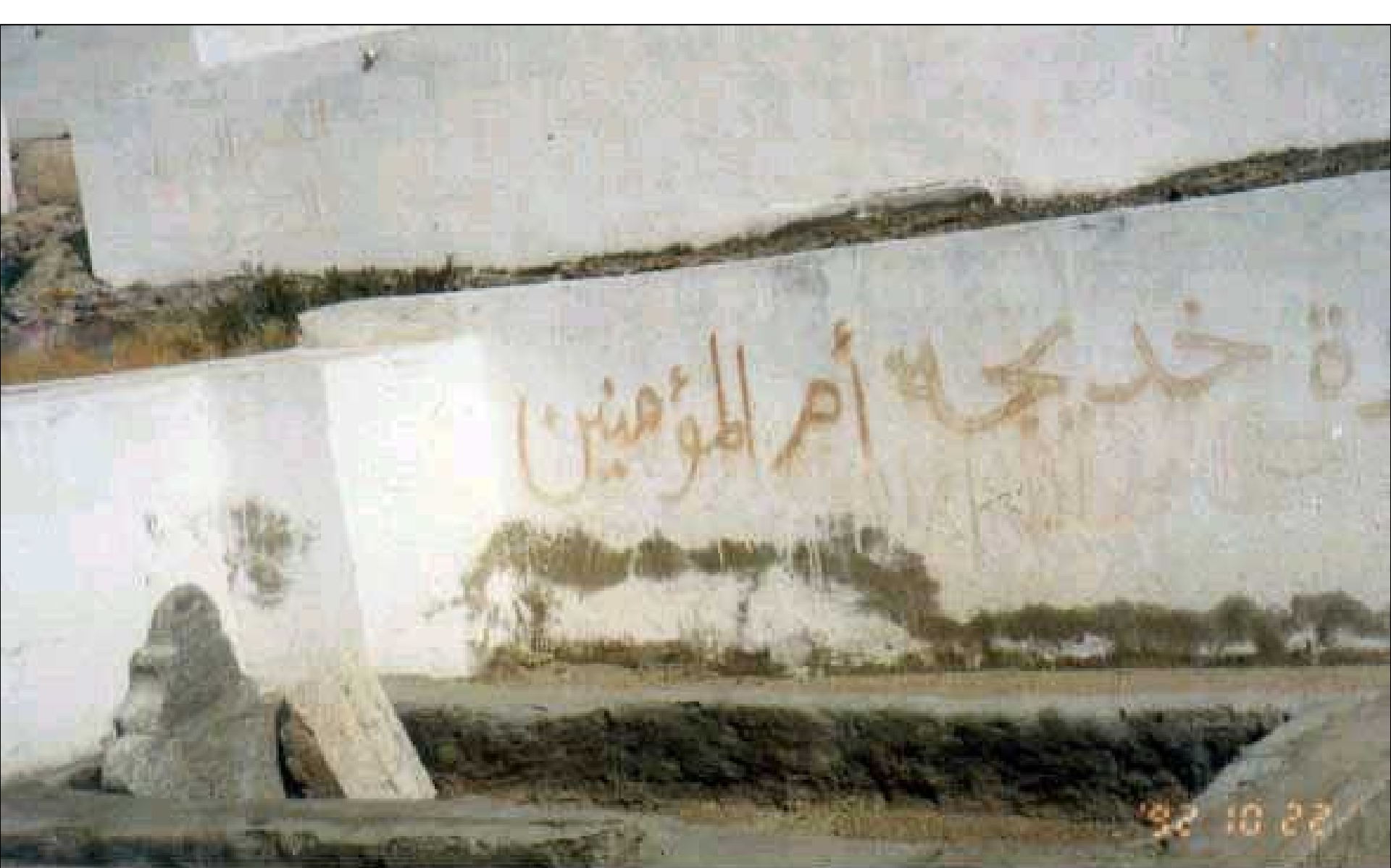
QABR-E-BIBI KHATIZA UMMUL MOAMINEEN MACCA