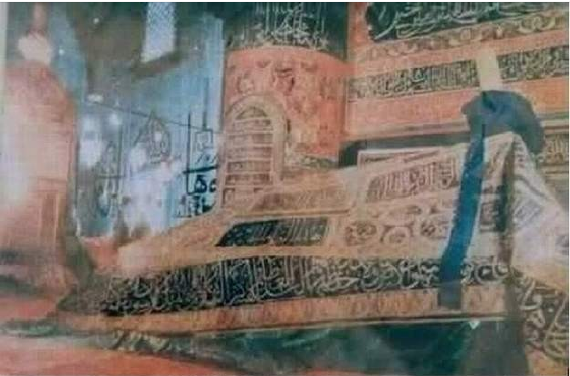
This is a view of Rauza e Rasool (P.B.U.H.) Which is not visible/open for Zayeriens / Visitors Perhaps not even 0.1% Muslims had the opportunity to see this View. Please pass it to all you know for the spiritual benefits. May Allah bless all of us (Ameen)