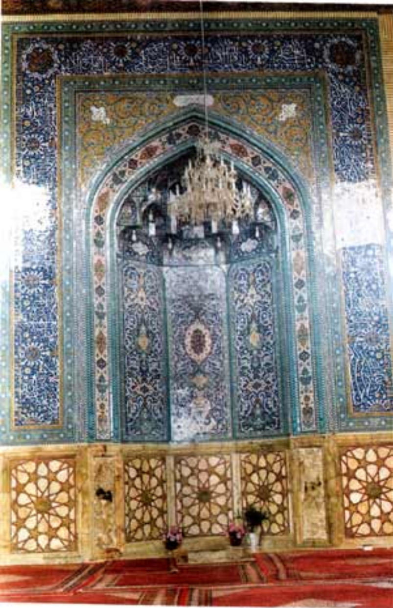
مسجد کا نقش و نگار شدہ محراب