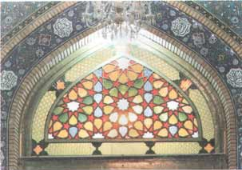
مسجد بگرامن کاشمالی دروازہ