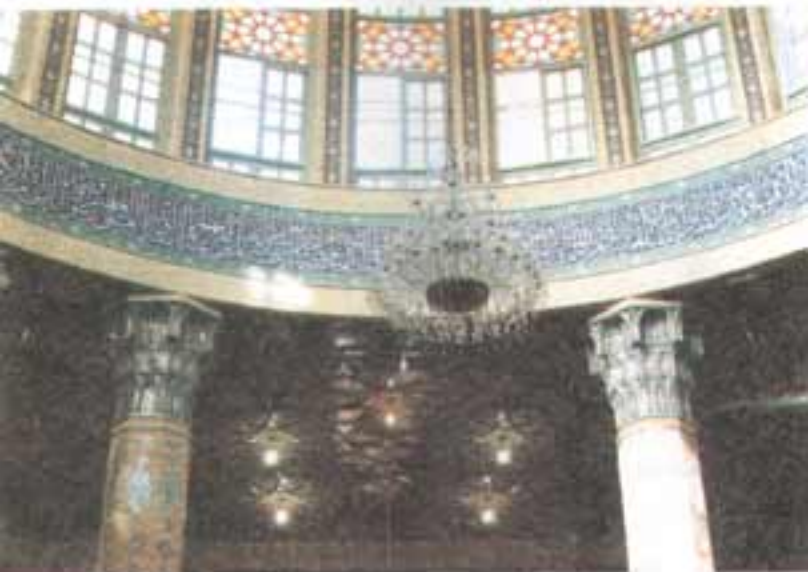
مسجد کے قبة کا اندرونی منظر